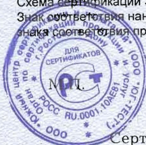
Схема сертификации 3, предусматривающая проведение ежегодного инспекционного контроля. Знак соответствия наносится в соответствии с Разрешением № 03488 от 03.06.2011 на применение знака соответствия при добровольной сертификации.